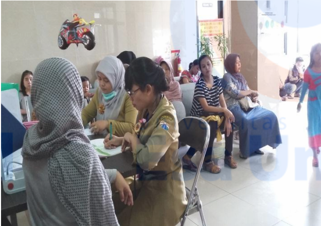
Gambar. 1. Ruang tunggu ibu hamil