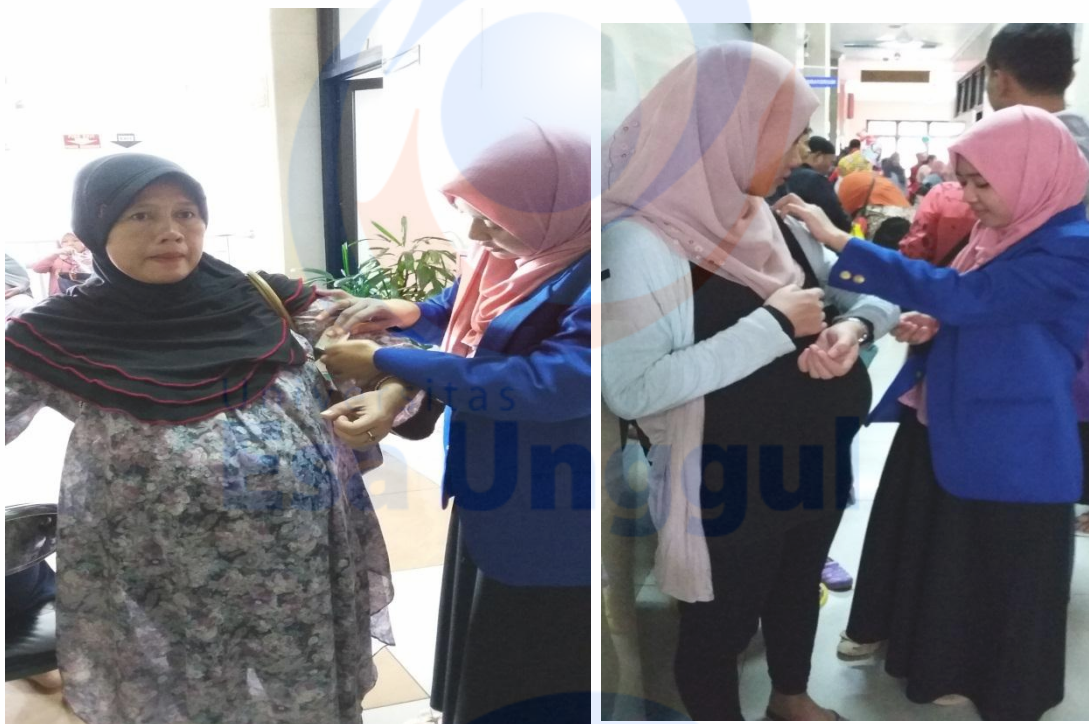
Gambar. 5 Pengukuran LLA Ibu Hamil