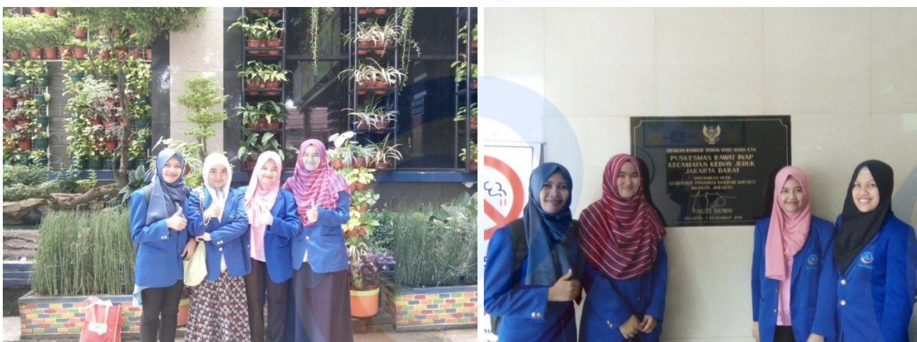
Gambar.7. Tim Enumerator