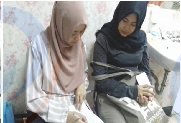
Gambar.3. Wawancara bersama responden